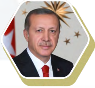
Ekselansları Sayın Recep Tayyip Erdoğan Türkiye Cumhurbaşkanı

Umman Sultanlığı'nın 2040 Vizyonu, ülkenin ekonomik çeşitliliğini artırmayı, sürdürülebilir kalkınmayı sağlamayı ve özel sektörle uluslararası iş birliğini güçlendirmeyi amaçlayan iddialı bir stratejik plandır.