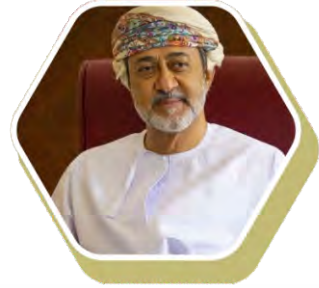
Sultan Haitham bin Tarik Al-Mu'azzam Umman Sultanlığı Sultanı ve Başbakanı

Türkiye Cumhurbaşkanı Sayın Recep Tayyip Erdoğan, ilişkilerimize kurumsal bir çerçeve kazandırmak arzusundayız. Bu amaçla, Yüksek Düzeyli Stratejik İş Birliği Mekanizması dâhil, istifade edebileceğimiz çeşitli seçenekleri ele aldık. Dış ilişkiler, ekonomi, sanayi, yatırım, sağlık, kültür, tarım ve hayvancılık gibi alanlarda iş birliğimizi ilerletmeye yönelik 10 belge imzalandı. Ortak bildiri kabul edildi. Ekonomi ve ticari ilişkilerimizi, mevcut potansiyelimizi yansıtacak şekilde ilk aşamada 5 milyar dolara çıkarmayı hedefliyoruz. Müteahhitlik firmalarımız, Umman'da bugüne kadar 7 milyar dolar değerinde projeyi başarıyla tamamladı. Aziz kardeşimle, şirketlerimizin Umman 2040 Vizyonu'na yapabilecekleri katkılara da değindik. Bu vesileyle, Umman heyetinin yarın Türk iş dünyasının temsilcileriyle yapacağı toplantıdan somut neticeler alınmasını temenni ediyorum. BOTAŞ ile Ummanlı muhatabı arasında imzalanan anlaşma uyarınca, 2025 yılından itibaren Umman'dan sıvılaştırılmış doğalgaz tedarikine başlanacak olmasıyla, enerji alanındaki iş birliğimizde yeni bir döneme girmiş olacağız.