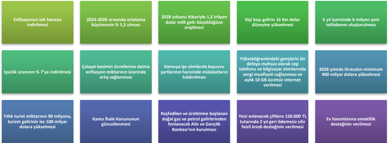
Şekil 2: 2024-2028 Hedefleri

Türkiye Cumhuriyeti Cumhurbaşkanı 2024-2028 yılları arasında belirlediği başlıca hedefleri aşağıda maddeler halinde sıralamıştır. Genel itibarıyla sosyal devlet anlayışını benimseyen ve ekonomik alandaki iyileşmelerle beraber bireylerin yaşam kalitelerini artıracak hedefler belirlenmiştir.