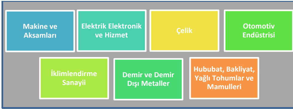
Tablo-3 Konya ve Türkiye'nin İran'a İhracatında Benzeşen Sektörleri

ihracatın sadece %2'sini gerçekleştirmektedir. İran'a yapılan ihracatta ilk 15'te yer alan sektörlerin 8 tanesi Konya'nın yüksek miktarlı ihracat yaptığı sektörlerdir. Bu dikkate alındığında, Konyalı sanayii ve iş adamlarının İran pazarını hafife almamaları gerektiğini göstermektedir.