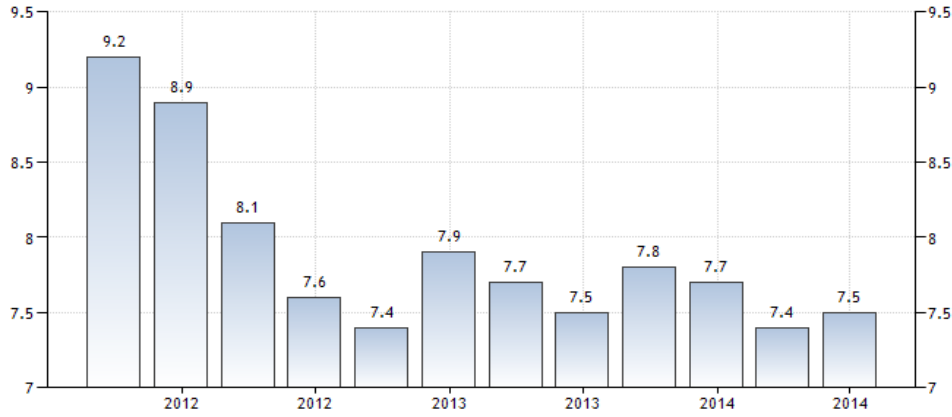
Çin Yıllık Büyüme Hızı

Önümüzdeki yıllarda Çin için büyüme tahminleri yüzde 4 civarındadır. Bu durum BRIC ve Çin için geleceğe dönük olumsuzlukları ortaya koymaktadır