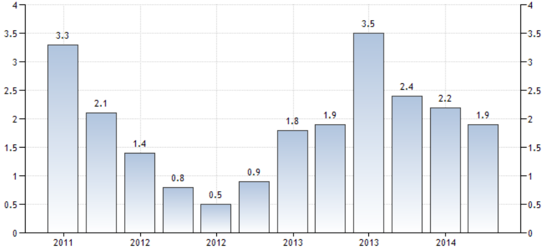
Brezilya GSYİH Yıllık Büyüme Hızı (TradingEconomics)

Son yıllarda tüketimin azalmasına bağlı olarak zayıflayan iç talep, fiyat artışlarının geri gelmemesi ihracatın büyümeye katkısını azaltmıştır. Çin'in metal ithalini azaltması beklentileri, metal ihracatçısı olan Brezilya'yı büyük ölçüde etkilemiştir. Bu durumun Brezilya'nın ihracat başarısını eskisi gibi sürdürmeyeceğini ortaya çıkarmıştır Brezilya için umut vadeden belki de tek nokta, sahip olduğu petrol kaynaklarıdır. Demir ihracatında azalma beklentisi, petrolün üzerindeki baskıyı daha da artıracaktır. Bu bağlamda, Brezilya'yı zor günler beklemektedir.